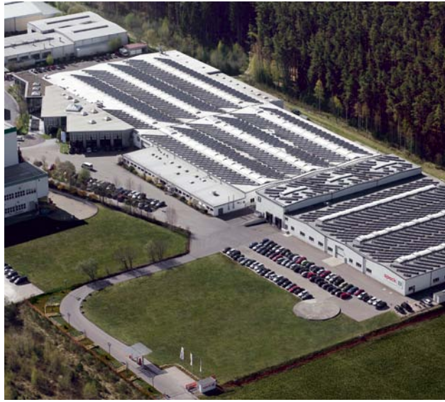
Speck Stammwerk in Roth

Ob Sie mit Berufserfahrung, als Berufseinsteiger, Praktikant, Werkstudent oder Auszubildender den Weg zu uns einschlagen möchten – wir freuen uns auf Ihre Bewerbung!